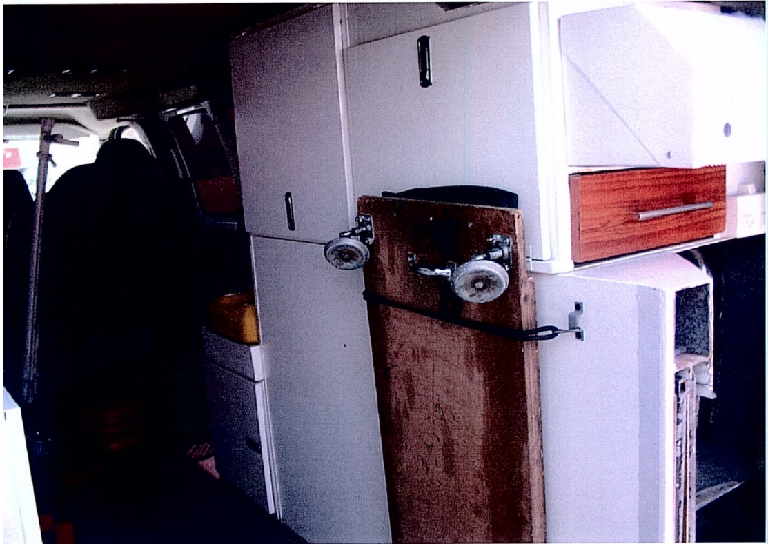
תמונה 8 תמונה 9