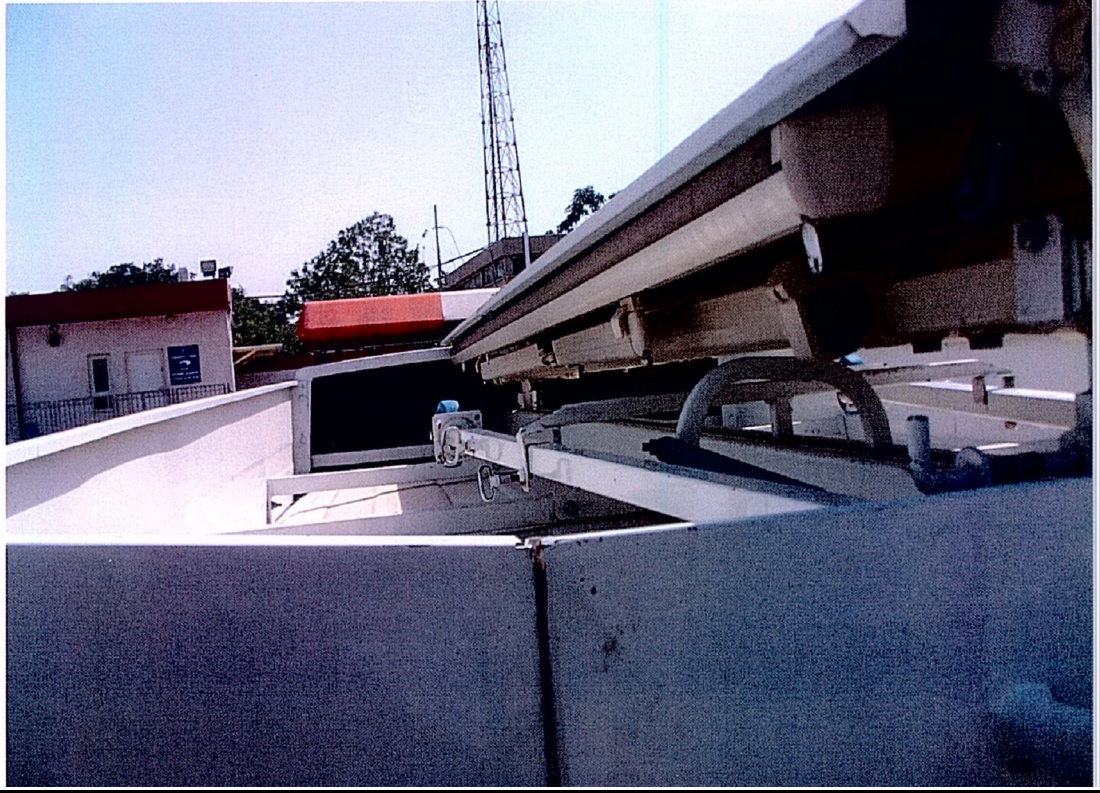
תמונות 2-3- מתקן הצללה נשלף